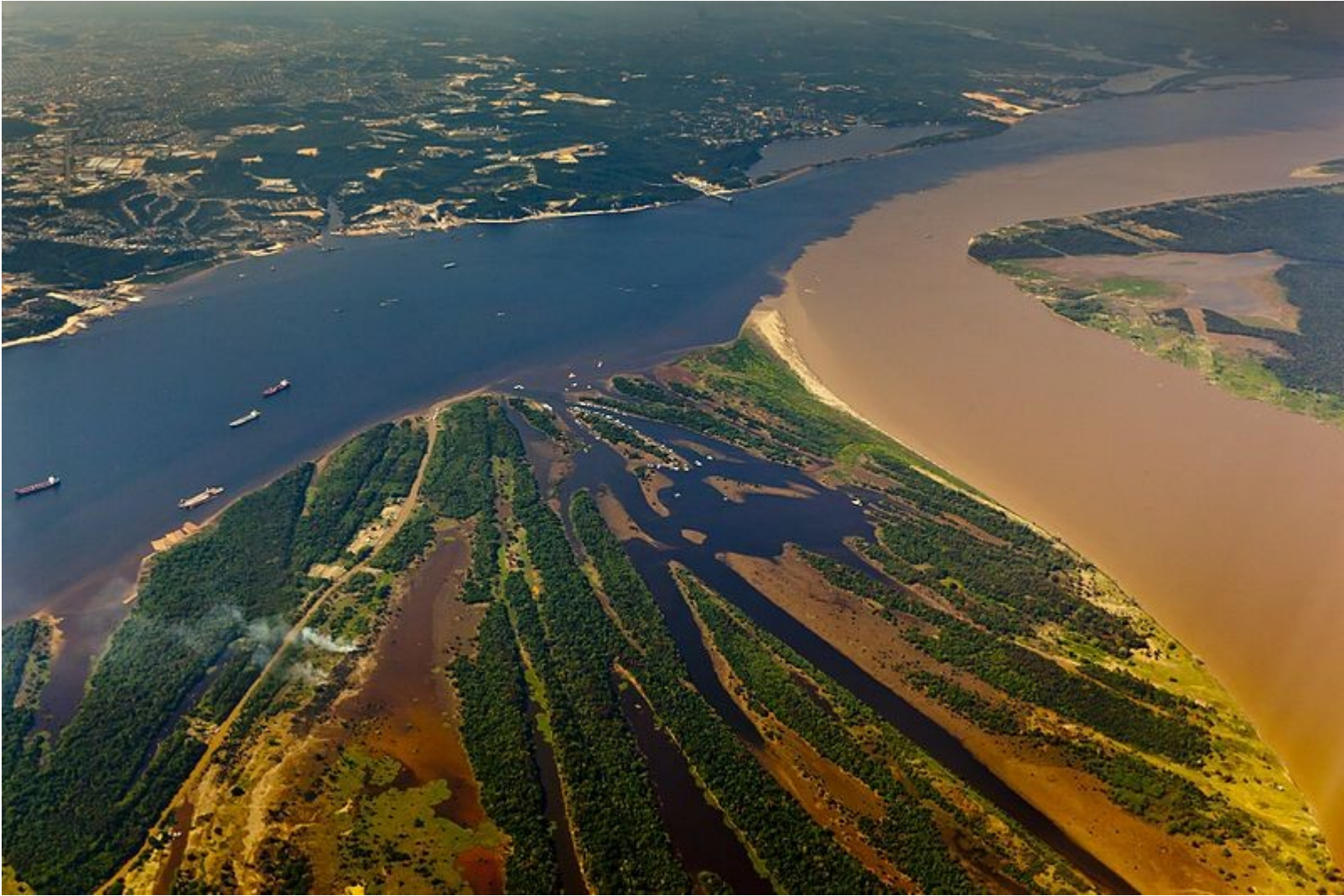
Author Portal da Copa This file is licensed under the Creative Commons Attribution 3.0 Brazil license https://commons.wikimedia.org/wiki/File:Encontro_das_%C3%81guas_-_Manaus.jpg

Der wichtigste Fluss ist der Amazonas, seine Wasserführung von 209.000 m 3 /s macht ihn zum weitaus wasserreichsten Fluss der Erde, größer als die sieben nächstkleineren Flüsse der Welt zusammen. Der längste Fließweg seines Flusssystemes misst 6448 km; in dieser Hinsicht wird er nur noch vom wesentlich wasserärmeren Nil übertroffen. Die bedeutendsten Nebenflüsse, der Rio Madeira und der Rio Negro, sind bereits mit den größten Strömen anderer Kontinente vergleichbar. Es folgen der Rio Ica und der Rio Tapajós. https://de.wikipedia.org/wiki/Brasilien