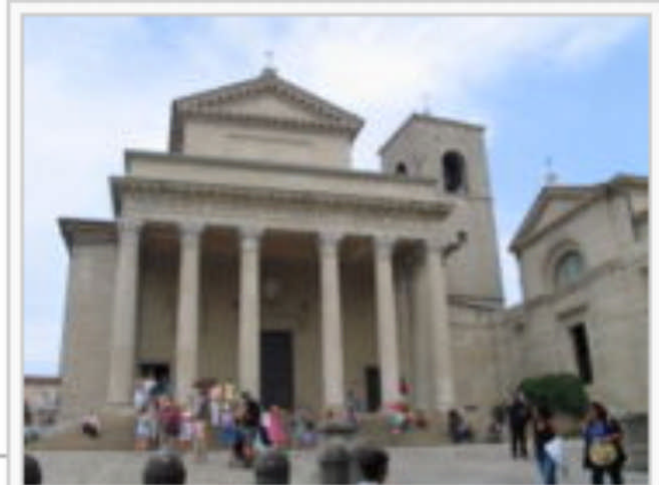
Basilica del Santo, 19. Jh.