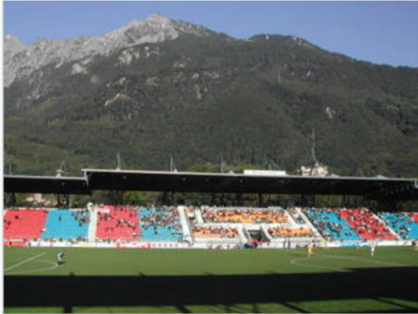
Fussballspiel im Rheinpark-Stadion Vaduz